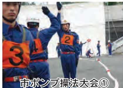
市ポンプ操法大会①