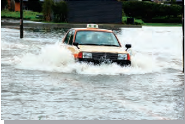
(大雨により冠水した道路)

今年は7月の水害により、小郡市初の避難勧告が発令され、戸惑われた方もいらっしゃるかと思います。お独りでお住まいの方、新しく小郡市民となられた方、もしもの時、それぞれの助けにと我々消防団があります。