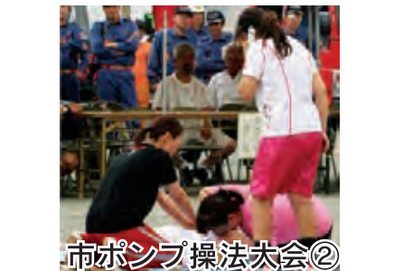
市ポンプ操法大会②